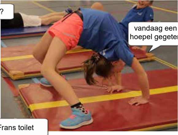
vandaag een hoepel gegeten