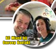
BC Mixed bij Omroep Kontakt