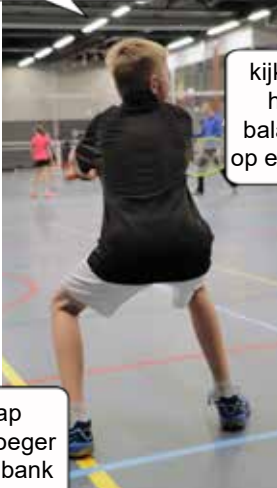
kijk eens hoe ik balanceer op een touw