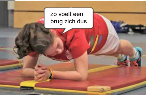
zo voelt een brug zich dus