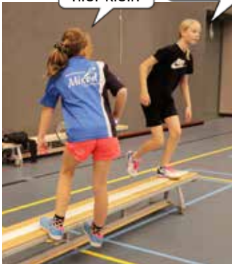
ons pap werkte vroeger al bij een bank