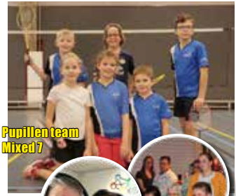
Pupillen team Mixed 7