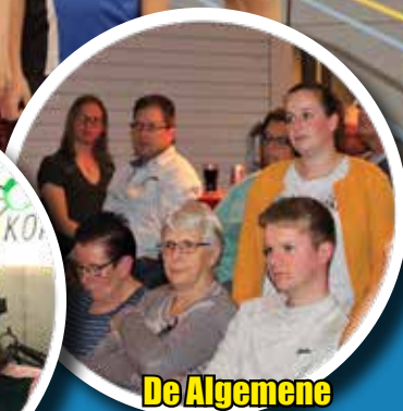
De Algemene Leden Vergadering