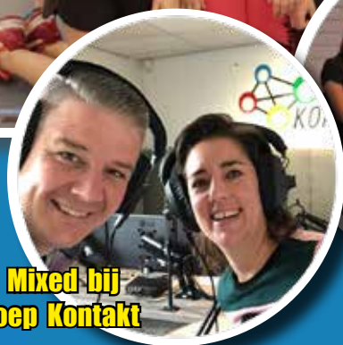
BC Mixed bij Omroep Kontakt