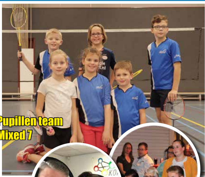
Pupillen team Mixed 7